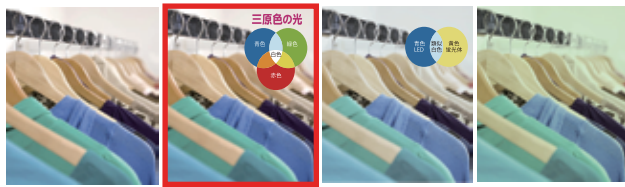
自然光 Ra100前後 無電極 Ra80 (青・緑・赤の3波長型) LED Ra70 (青色LED+黄色蛍光体) 水銀灯 Ra40前後

太陽光に近い光なので、物の色が綺麗に見えるので視認性が抜群なので作業効率もUP。