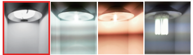
無電極 メタルハライド ナトリウム灯 蛍光灯